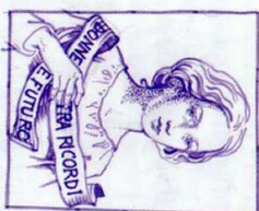
Il logo del Premio è opera di Antonella Cappuccio